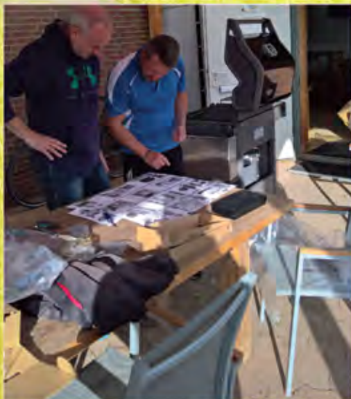
Foto: Scheinbar nicht ganz so einfach war der Zusammenbau des neuen Gasgrills.

Die Spartenmeisterschaften wurden dieses Mal als Damen und Herren-Doppel ausge-