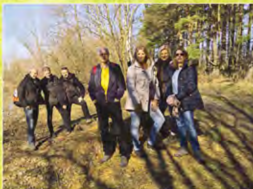
Foto: Traumwetter bei der Grünkohlwanderung der Tennissparte.