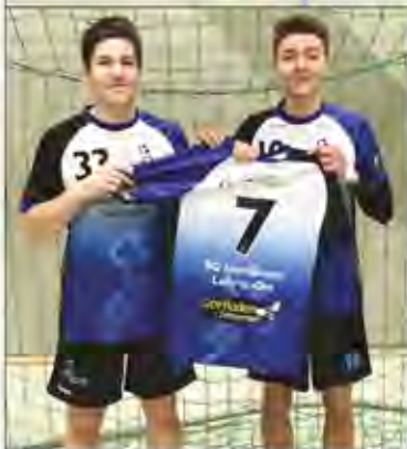
Foto: Die Handball A-Jugend der Spielgemeinschaft in ihren neuen Trikots.