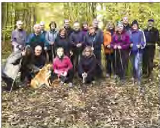
Foto: Die Nordic-Walking-Runde vor der T-Shirt-Party, im November in Hämelerwald.

Von Anja Johannsen. Bereits im Frühjahr hatten die Nordic Walkerinnen und Walker aus Immensen, Sievershausen und Arpke am Volkslauf in Hämelerwald teilgenommen. Da bei allen der Spaß und die Fitness im Vordergrund steht, waren die einzelnen Platzierungen für die Gruppe nicht so wichtig, aber es gab trotzdem einzelne, persönliche Erfolge.