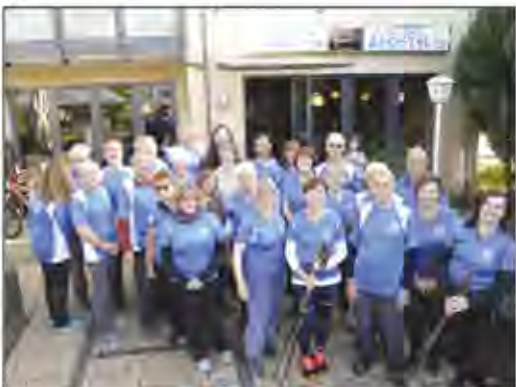
Foto: In den neuen Trikots bedankten sich die Nordic Walker bei dem Sponsor.