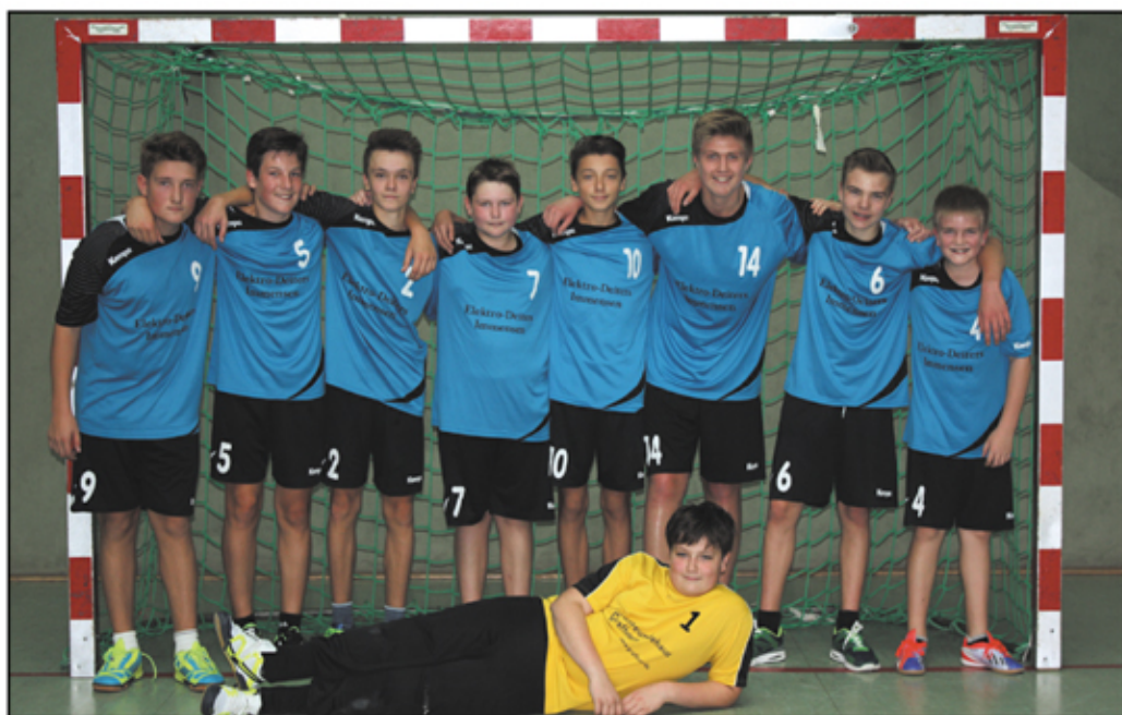
Foto: Die männliche Handball C-Jugend in den neuen Trikots, gesponsert von der Firma Elektro Deiters.