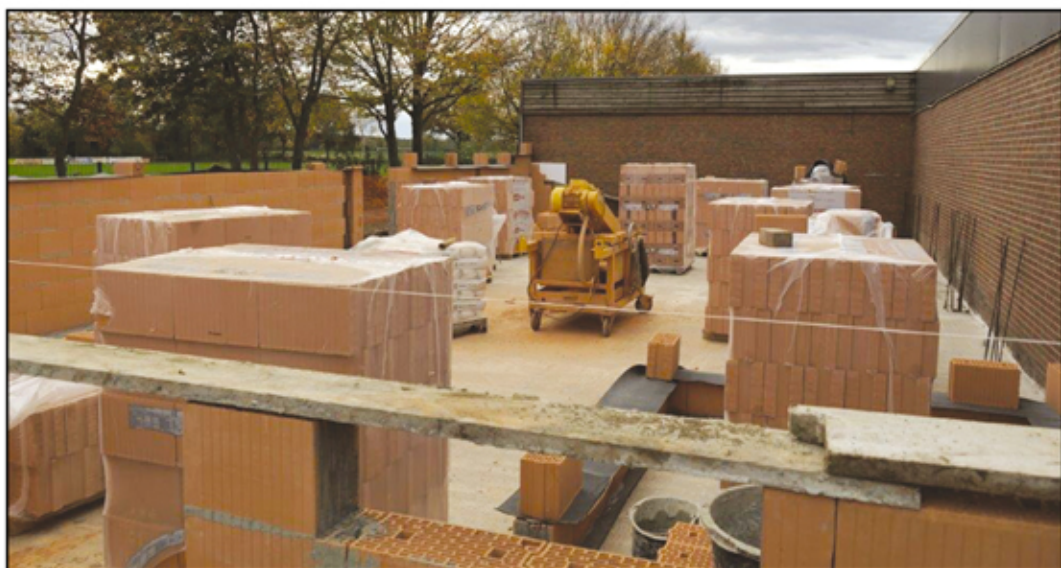
Bau des Untergeschosses im November 2014.