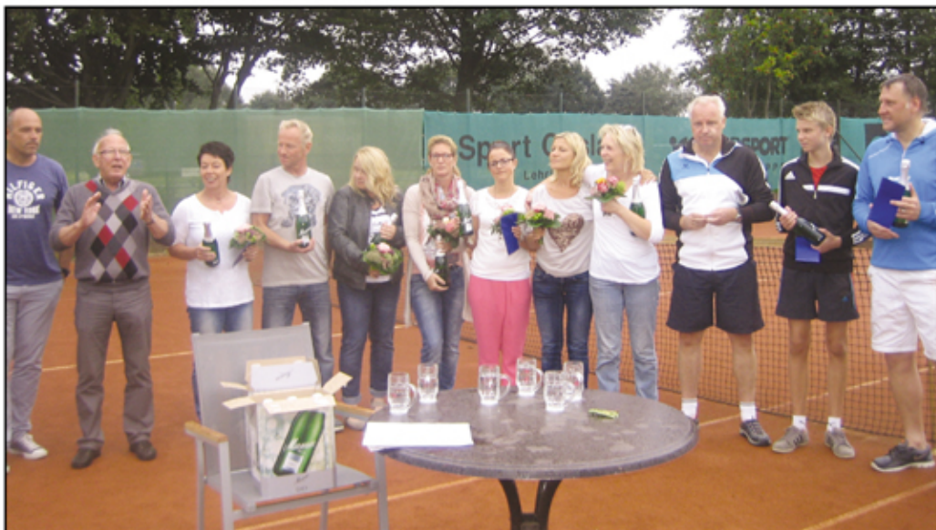
Foto: Siegerehrung der Spartenmeister.