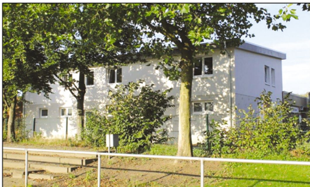
Foto unten: Der Anbau im September 2015 vom Sportplatz aus gesehen.

Foto oben: Links der neue Anbau und rechts das „alte“ Sportheim.