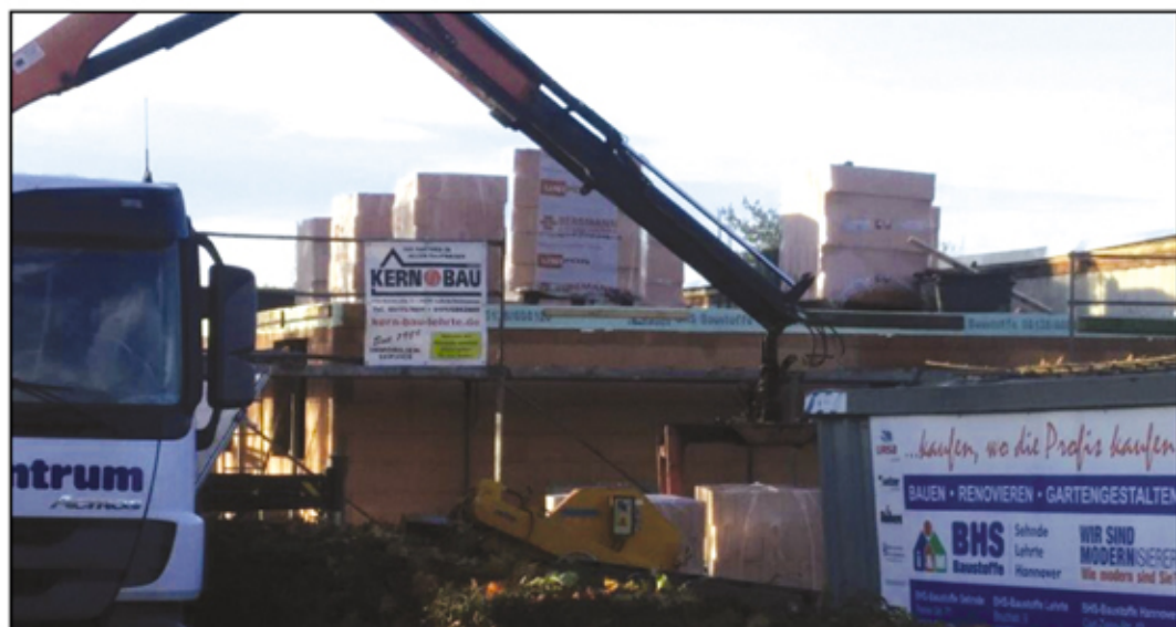
Bau des Obergeschosses im November 2014.

vom Beginn am 1. Oktober 2014 bildlich festgehalten.