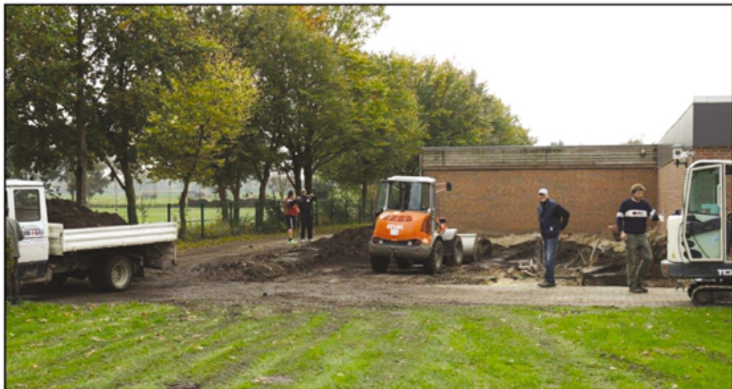
Beginn des Anbaus am Immenser Sportheim am 1. Oktober 2014 mit dem Bauaushub.