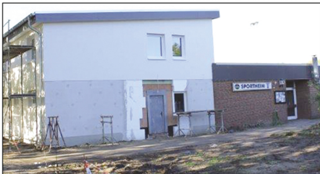
Foto oben: Links der neue Anbau und rechts das „alte“ Sportheim.

Auf der Baustellen-Party am vergangenen Sonntag konnten sich die Gäste selbst ein Bild über den aktuellen Stand machen