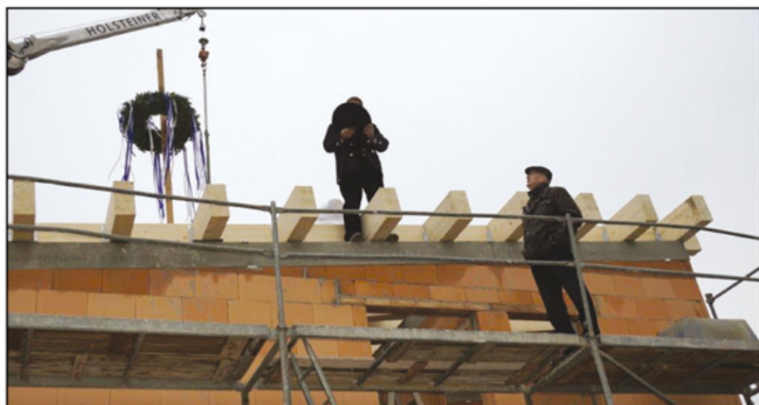
Richtfest im November 2014.