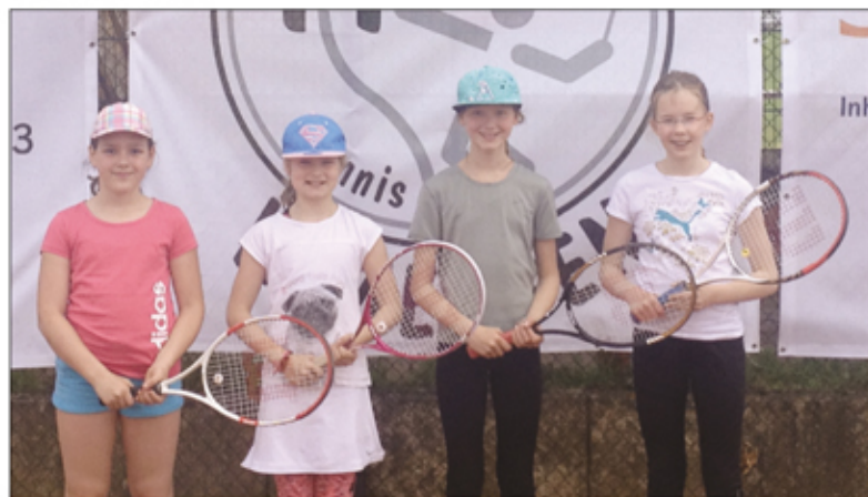
Im Bild die C-Juniorinnen des MTV Immensen.

Bevor sich die Tennissparte zum Teil in den Winterschlaf verabschiedet, sei noch daran erinnert, dass wir auch in diesem Jahr wieder mit einer Bude auf dem Weihnachtsmarkt in Immensen vertreten sein werden. Und wie sollte es anders sein, wollen wir erneut alle Besucher mit unseren leckeren Kartoffelspiralen und Dipp verwöhnen. Also, wir freuen uns auf zahlreiche Besucher des schon traditionellen Weihnachtsmarktes. Schaut bei uns vorbei!