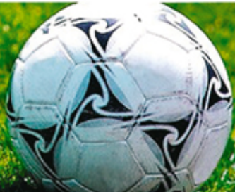
Tabelle / Termine