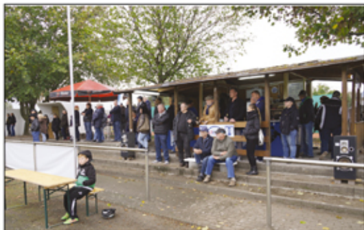
Foto oben: Gut besucht war am Sonntag, 9. Oktober die Arena am Fleith beim Spiel gegen den TSV Kleinburgwedel.

Von Manfred Matschkus. Sehr gut in die Saison 2016/17 gestartet ist die 1. Fußball-Herrenmannschaft des MTV Immensen. Nach 10 Spieltagen belegt die Mannschaft mit acht Siegen, einem Unentschieden und einer Niederlage Platz 2 in der Tabelle, der am Ende der Saison zum Aufstieg in die Kreisliga reichen würde. Hoffen wir alle, dass das Team weiterhin ihren bisher erfolgreichen Weg geht und ihr Ziel, ganz oben mit dabei zu bleiben, umsetzt. Einen ausführlichen Bericht zur Lage lesen Sie in der MTV-Echo Sonderausgabe zum Hallenturnier am 22. Dezember 2016.