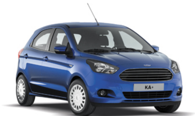
Abbildung zeigt Wunschausstattung gegen Mehrpreis.

Praktische Details, clevere Technologien und durchdachtes Design vereint mit ungeahnt viel Komfort, Sicherheit sowie großartigem Fahrspaß.